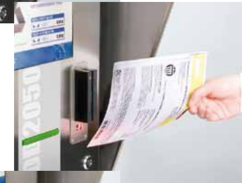
Doppio lettore magnetico e di bar code